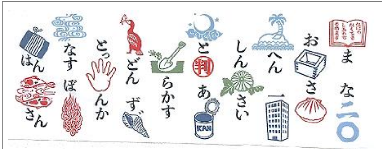
ほんま浪華判じ絵