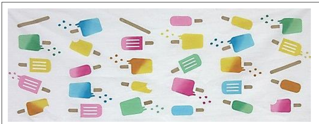
アイスクャンディパーティ